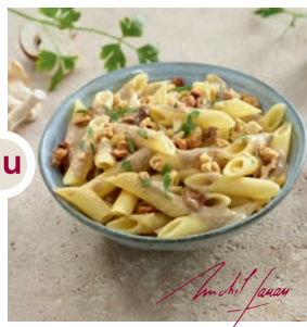
Penne à la crème de champignons