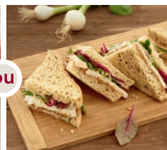
Club poulet (1) salade, confit d'oignons