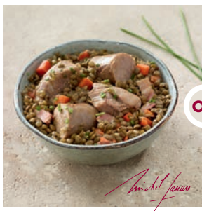
Petit salé aux lentilles vertes