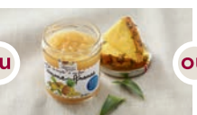
Purée pomme ananas