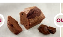
Moelleux au chocolat