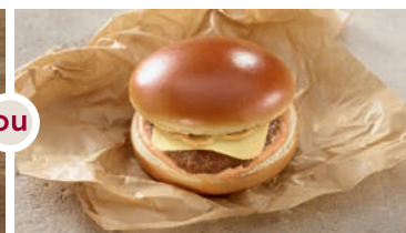
Burger bœuf charolais, fromage, sauce chargrill