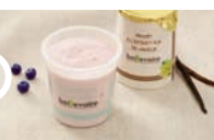
Yaourt vanille ou Fromage blanc