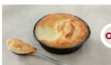
Tartelette soufflée fromage blanc