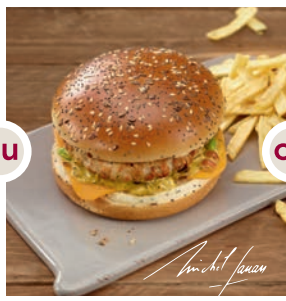
Burger poulet et Chips allumettes