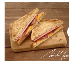
Club jambon (1) bacon (1) , mimolette